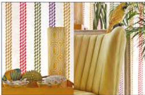
Página 24 e 25

Base 100% CO - Embroidery 100% VI 150 cm (usable 135 cm)