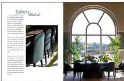
Página 26 e 27