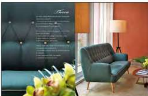
Página 40 e 41