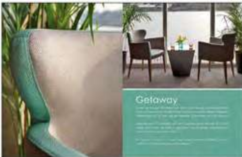
Página 38 e 39