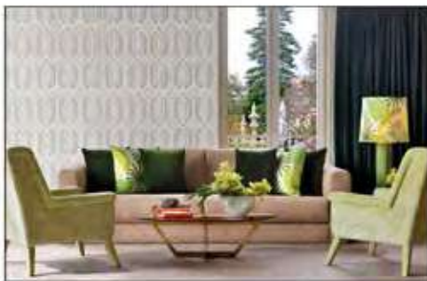
Página 30 e 31

Base 100% CO - Embroidery 100% VI 150 cm (usable 130cm)