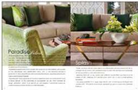
Página 32 e 33