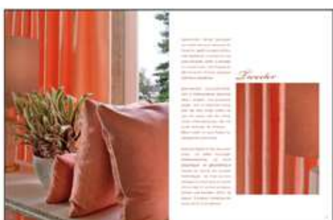
Página 44 e 45

30% CU + 26% LI + 32% VI + 12% PL | 137 cm