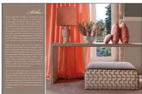
Página 42 e 43