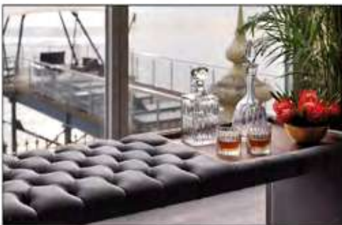
Página 36 e 37