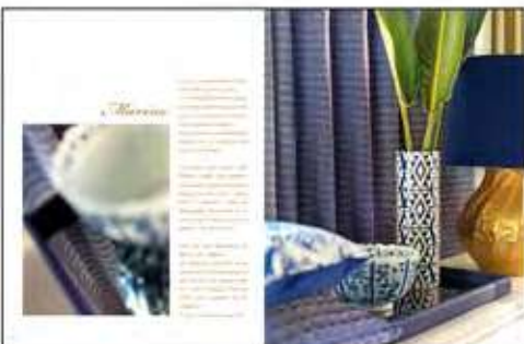
Página 18 e 19

Base 100% LI - Embroidery 100% VI 142 cm (usable 126 cm)