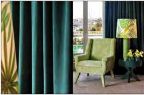
Página 34 e 35