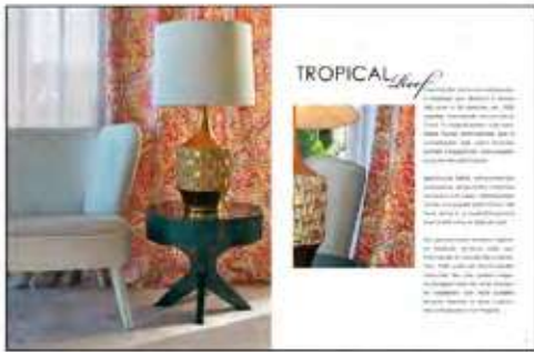
Página 28 e 29