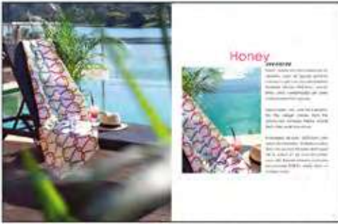
Página 12 e 13