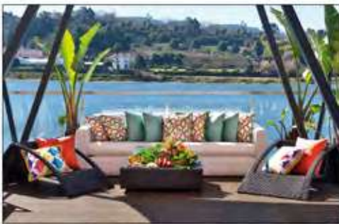
Página 14 e 15

Base 100% LI - Embroidery 100% VI 142 cm (usable 127,5 cm)