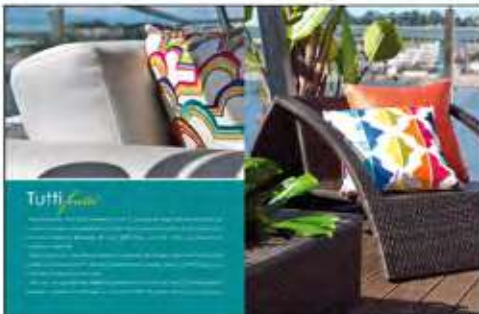
Página 16 e 17