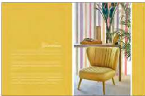
Página 22 e 23