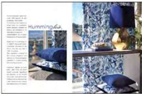
Página 20 e 21